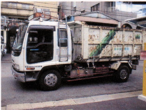
いすゞ4トンダンプ

現在、三菱大型車 エンジン6D40での10トン積載、80Km/h一定速での燃料費削減率は17%(軽油120円 メタノール35円)のデータがでています。